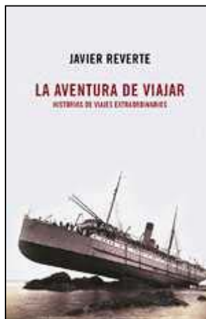
La aventura de viajar. Javier Reverte

Javier Reverte narra as súas mellores viaxes dende a infancia ata a actualidade; como neno, como turista, como enviado especial, como periodista e escritor... Un libro de recordos e impresións. Polas súas páxinas desfilan os escenarios xeográficos máis variados xunto cunha galería de personaxes de toda condición. É a paisaxe física e humana dunha filosofía da vida que ten a viaxe como centro.