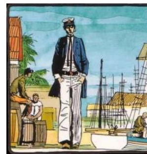
Corto Maltés. Hugo Pratt.

Brincos nas orellas, patillas poboadas, ollos cor de mel e un sorriso sempre inquedante nos duros beizos. As aventuras de Corto Maltés recollen as andanzas deste mariño, algo cínico e sentimental, por continentes e países moi diversos, entroncando a ficción con acontecementos históricos reais e con personaxes literarios coñecidos.