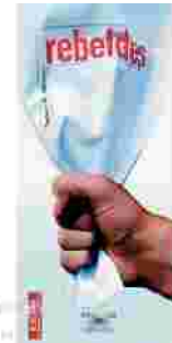
Hinton, Susan. Rebeldes..