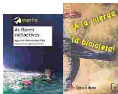
Fdez Paz, A. As flores radiactivas . Moure, G. ¡A la mierda la bicicleta!

Esta afección do realismo crítico pode alterar a conducta individualista dos suxeitos, facendo brotar compromisos sociais e episodios de preocupación polo entorno.