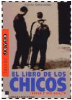
El libro de los chicos. Schneider, S

A autora consegue cunha linguaxe nítida disipar dúbidas, temores, preocupacións de todo adolescente.