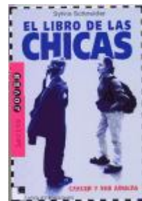
El libro de las chicas. Schneider, S.